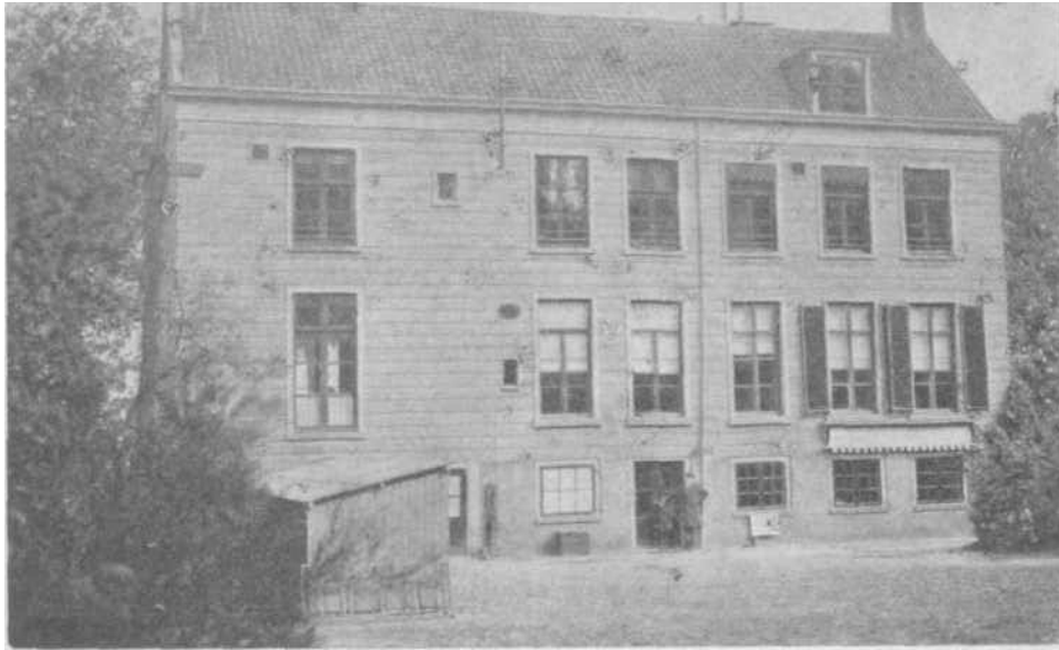
De achterkant van de oude houten kast op 'n Zondagochtend; links de (ietsenkast; links op de verdieping het raam van de „aula“; rechts onderaan het chemie-sousterrain.

In het Lied van de houten kast , uit de Lyceumrevue, waaruit de zo net geciteerde dichtregelen genomen zijn, klonk het in een ander couplet: