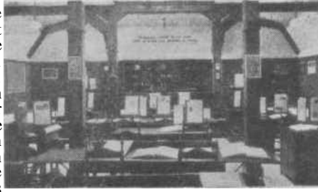
Lokaal in 1925, voor het „Kennemer Stelsel” ingericht.