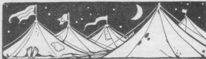
Tekening voor een der rubrieken van de Lyceumkrant, van A. Pieck.

in vooraanstaande figuren op verschillend gebied tot de school; de school bleef het leven zoeken door excursies, bezoek aan toneelvoorstellingen, muziekkuitvoeringen, door organisatie van klasse-avonden, gemeenschappelijke maaltijden, enz. enz. Vanuit Aelbertsberg is ook voor de eerste maal, in 1924, het Lunterense kamp bezocht, hèt Kamp , dat met zijn aanvulling en variatie in de vorm van het Schoolhuis , van grote vormende waarde is geweest voor vele geslachten van leerlingen, en tot een bron van intens levensgeluk. Toevallig zeiden eens, op een scheidingsdag aan het einde van een schooljaar, twee vooraanstaande vaders, de één een bekend medicus, de ander een zakenman, tot de rector: „wij willen niets tekort doen aan de waarde van het onderwijs van U en Uw staf van uitstekende docenten, maar wij zijn U evenzeer, neen, misschien nog meer, dankbaar voor wat de school aan de karaktervorming, de mens-ording van onze kinderen heeft gedaan, door Lunteren, door Auby, door zoveel meer! Non scholae sed vitae! ”